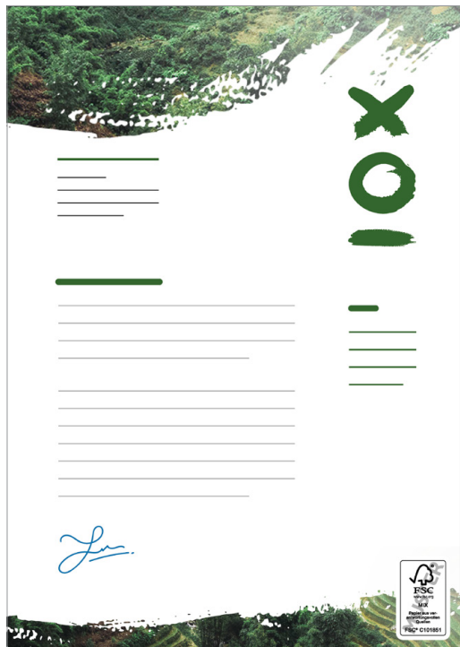
Emplacement du label FSC® : recto, en bas à droite

Exemple pour A5 (210 x 148 mm) horizontal