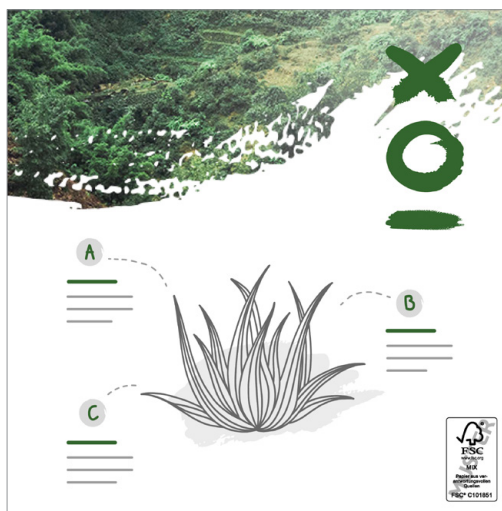
Emplacement du label FSC® : recto, en bas à droite