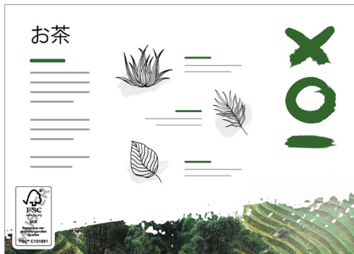
Emplacement du label FSC® : verso, en bas à gauche

Exemple pour A5 (210 x 148 mm) horizontal